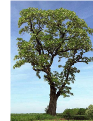
2020 Robinie / Schein-Akazie